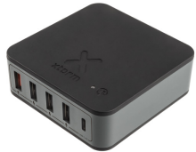
Desktop Multi Charger 60W